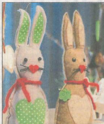
Auch für das Osterfest gibt es viele Angebote.

Ideen zu neuen Projekten einholen und vielleicht das ein oder andere Geschenk