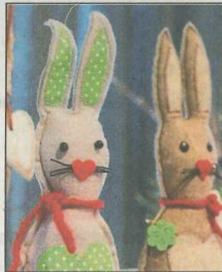
Auch für das Osterfest gibt es viele Angebote.

Auch in der Mode ist alles aufs Frühjahr gerichtet, ob gefilzt, gestrickt oder gehäkelt. Auf die unterschiedlichsten Kreationen darf gerne ein Blick oder auch zwei geworfen werden. Für die Kleinen gibt es Babykleidung, Krabbeldecken oder die ersten Lederschuhe, alles in Handarbeit hergestellt. Einigen Ausstellern